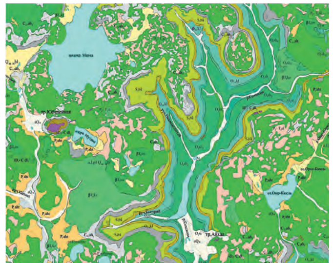
Рис. 1 Геологическая карта территории исследований

Далдынская серия в пределах участка исследований сложена преимущественно глубоко метаморфизованными бескварцевыми сланцами. Верхнеанабарская серия представлена кварцсодержащими метаморфизованными кварцитами, с линзами гнейсов и высокоглиноземистых сланцев. Хапчанская серия сложена преимущественно